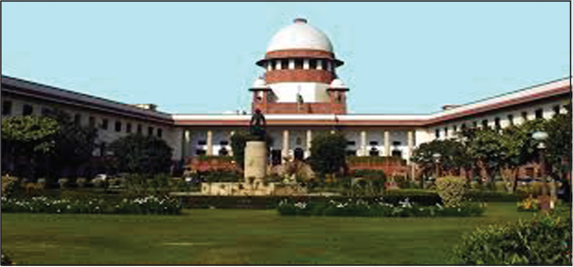
સર્વોચ્ચ અદાલત - દિલ્લી

મૂળભૂત હકોના પાલન માટેનો અધિકાર સર્વોચ્ચ અદાલત પાસે છે. કોઈ પણ વ્યક્તિ કે સંસ્થા સર્વોચ્ચ અદાલતમાં ન્યાય મેળવવા અરજી કરી શકે છે.